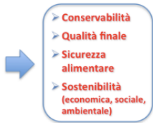
Fig. 1 Organizzazione del Progetto